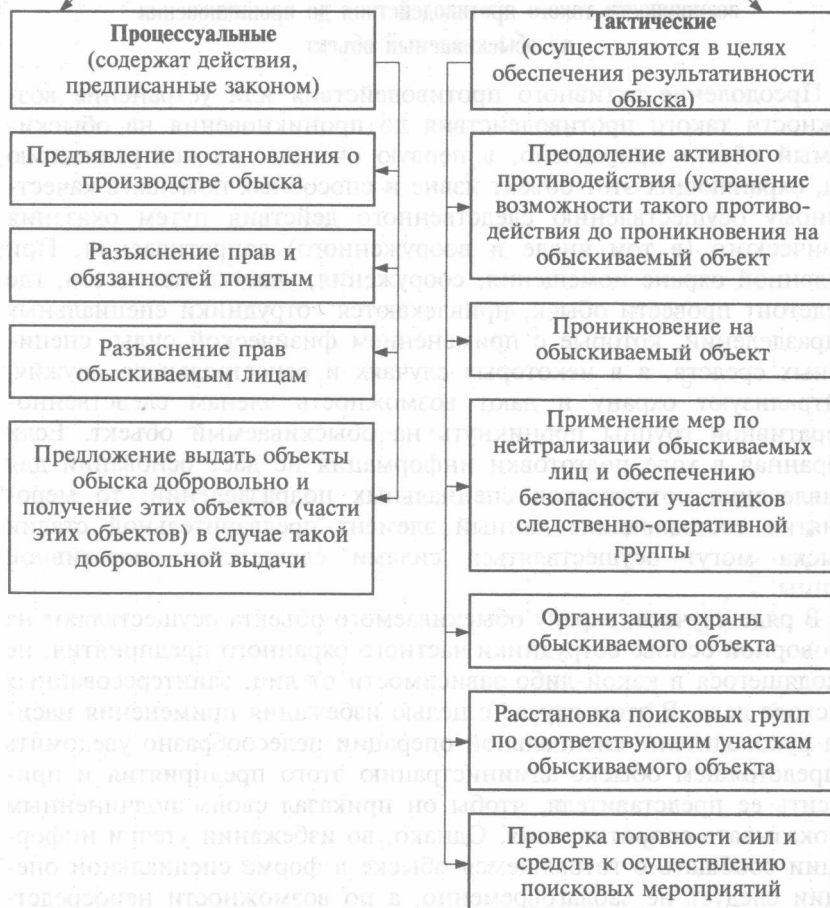
Схема 4. Элементы предварительной стадии производства обыска в форме специальной операции

Для изучения специфики предварительной стадии производства обыска в форме специальной операции необходимо рассмотреть