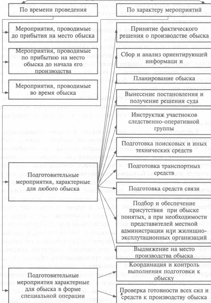
Схема 3. Система мероприятий, осуществляемых при подготовке к обыску в форме специальной операции